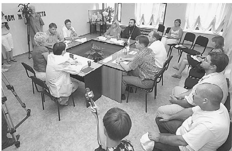
Разговор за круглым столом был не из лёгких.

- Явление, о котором мы говорим, возникло в начале 90-х годов прошлого века. Это начало капитализации страны и общества. Семья оказалась отключённой от воспитания детей, семья зарабатывала деньги, чтобы выжить в нелёгких экономических условиях. Наряду с этим произошли реформы образования. В результате те нормы, которыми мы могли сдерживать